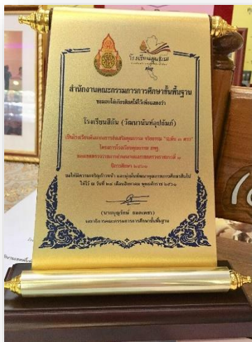
รางวัลโรงเรียนคุณธรรม สพฐ. ระดับ ๓ ดาว