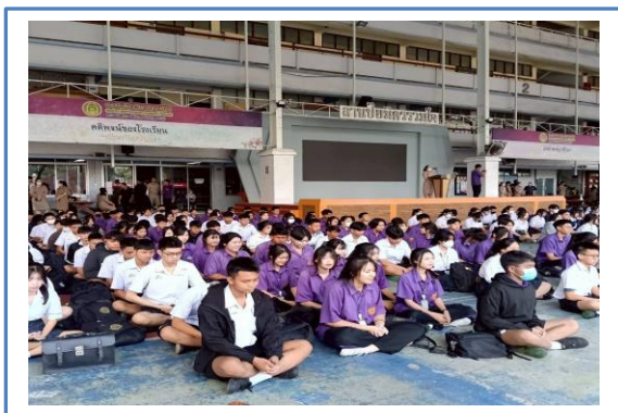
กิจกรรมสวดมนต์ นั่งสมาธิในตอนเช้า หลังเคารพธงชาติ