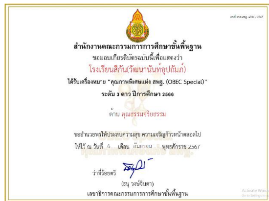
รางวัลคุณภาพพิเศษแห่ง สพฐ. OBEC Special ระดับ ๓ ดาว ด้านคุณธรรม จริยธรรม