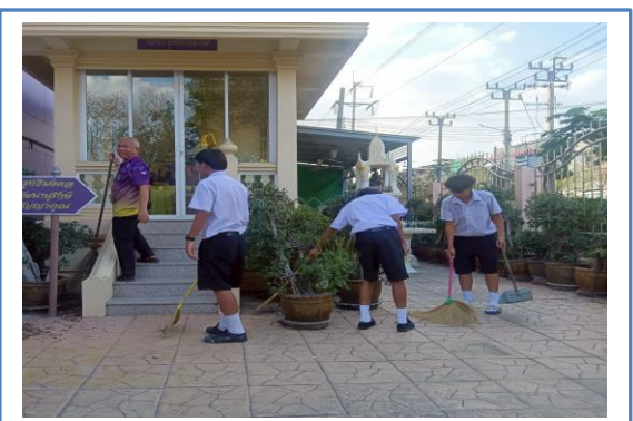
กิจกรรมบำเพ็ญประโยชน์